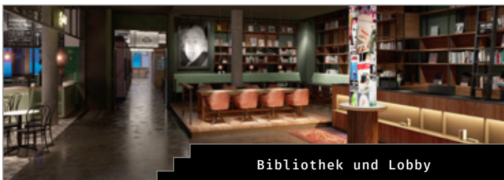
Bibliothek und Lobby