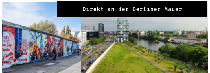
Direkt an der Berliner Mauer